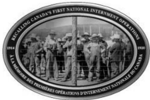
100th Anniversary Plaque

To mark the 100th anniversary of Canada's first national internment operations of 1914-1920, the Ukrainian Canadian Civil Liberties Foundation will be unveiling 100 plaques across Canada on Friday, 22 August 2014, the 100th anniversary of the War Measures Act.